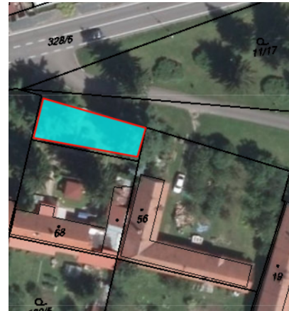
Příloha č. 5