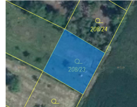
Příloha č. 3