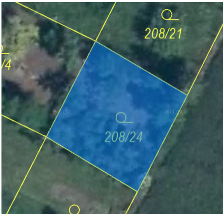
Příloha č. 4