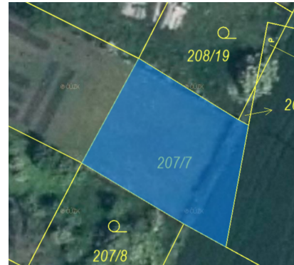
Příloha č. 2